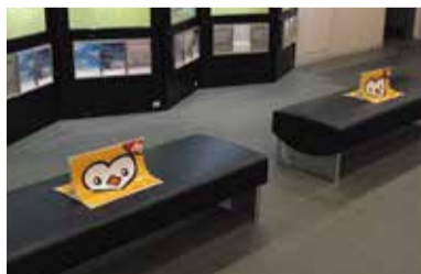
ベンチもソーシャルディスタンス