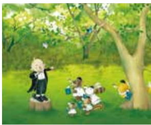
イラスト:服部美法

童謡や唱歌などピアノ伴奏にあわせて、なじみ深い名曲の数々を歌います。経験、年齢を問わず、歌の好きな方のご参加お待ちしております。