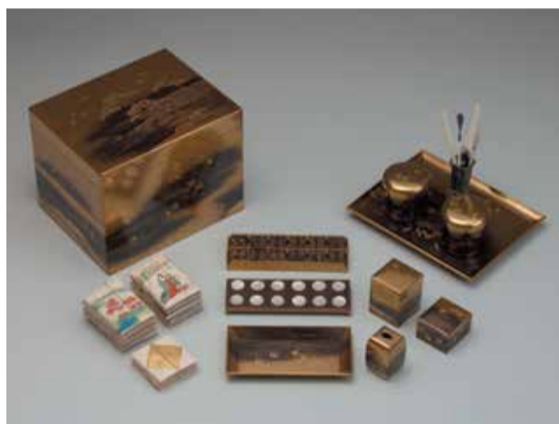
図1《浜松塩屋蒔絵十種香箱》明治時代 高砂コレクション