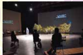
7月19日 第七劇場「山月記」(中ホール)