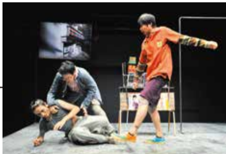
2011「投げられやすい石」舞台写真

今年はコロナ禍や気候変動で、思うに任せない事象が増えました。シンプルだけれど奥深い台詞と装置で、観客の想像力を耕すハイバイ。その舞台では解決困難な問題に悩む人物が、大きな共感を集めるかもしれません。