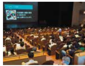
7月5日 小林弘幸講演会(中ホール)

終演後、清掃スタッフだけでなく、事業担当者も加わって、スプレー片手に消毒開始。次の公演も皆さまが安心して楽しんでいただけますようにとの思いを込めて。