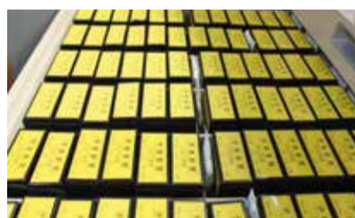
伊勢新聞のマイクロフィルム