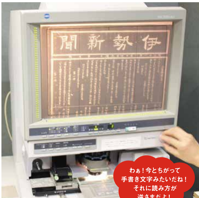
マイクロリーダーで伊勢新聞の創刊号を見たよ!

たとえば新聞。かるみーも見たことがあると思いますが、新聞紙は紙がとても薄くて長期保存には向きません。図書館では昭和30年代以降