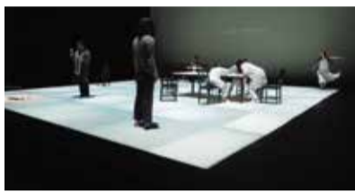
2014年・台湾公演 ©第七劇場

若き芸術家と女優の儂い恋。「ワーニャ伯父さん」「三人姉妹」「桜の園」に続くチェーホフ四大戯曲のひとつ。三重県津市美里を拠点とする第七劇場の代表作が、10年ぶりに帰ってきます!