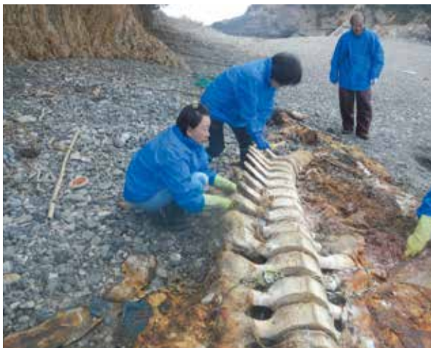
手作業での解体と骨の回収

場所ではなく、重機を入れることができなかつたため、海岸管理者である県尾鷲建設事務所の協力を得て、現地で解体と骨の回収を進めることとなりました。徒歩で海岸へ向かい、手作業で少しずつ解体と骨の取り出しを行うという、とても地道な作業でした。クジラは子どもとはいえ非常に大きく、博物館職員のみでは、不可能と思われる作業でしたが、ホネ探の方々をはじめ、多くの方の協力により、半年間かけて、ついにすべての骨の回収を終えることができました。