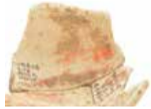
土器の中にこびりついた水銀朱

「水銀朱」は三重県が有数の産地である「辰砂」からできる赤い粉です。古代にどのように水銀朱を使っていたのかを、中国思想との関係も踏まえながら、出土品や最新の研究を基にお話します。