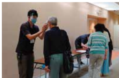
貸館抽選会も検温後、入室いただいています。