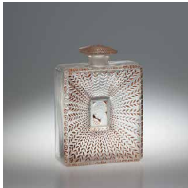
ルネ・ラリック《香水瓶「美しい季節」》1925年 高砂コレクション