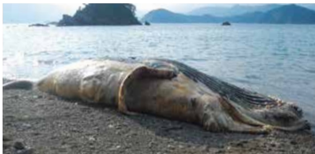
紀北町で海岸に打ち上げられたクジラ

昨年11月、この「ホネ探」始まって以来の大型に出会えました。なんと、紀北町東長島の海岸に1頭のクジラが打ち上げられたのです。このクジラは体長約8メートルのザトウクジラで、まだ、1歳前後の子どもだと考えられました。当館にはザトウクジラの標本はなく、なんととしてもこの個体を記録に残したいと考えました。クジラが座礁した海岸は、道路に面した