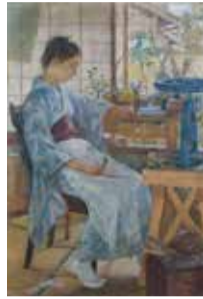
藤島武二「造花」1901年 油彩・キャンバス 東京藝術大学蔵