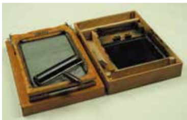
謄写版 ローラーが乗っている スクリーンにロウ紙は 貼り付けていません

に鉄筆で文字を書き、製版を作ることを指し、謄写版で印刷することをガリ版印刷と呼ぶのもこの独特な擬音が語源となっています。「ガリを切る」こと以外はとても簡単でしたので、日本では昭和40年代くらいまで簡易な印刷機として学校などで盛んに使われました。