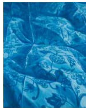
藤原康博 《迷宮～記憶の稜線を歩く～》 2023年 油彩・キャンバス 作家蔵 ©Yasuhiro Fujiwara