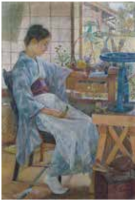
藤島武二《造花》1901年 油彩・キャンバス 東京藝術大学蔵