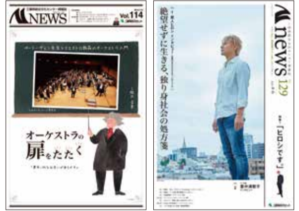
次号の予習になるかも…