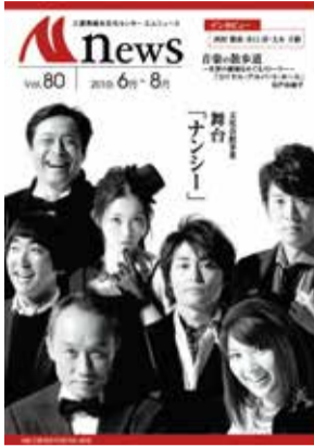
今からちょうど10年前のMnews！当時は冊子でした。

そういえば、なぜMnewsはこの形になったのでしょうか… Mnewsは「タブロイド判」という形を採用しています。振り返れば、Mnewsの歴史上、冊子だった時代がありました。今読み返しても立派だなあ…とうっとりする紙面。そう、冊子はお値段が高いのです！当時の発行部数は2.1万部。現在は4万部。単価のコストカットの分、多くの方にお届けできるように、増刷分の2万部は毎回新聞折込で、まだ会えていないMnews読者拡大につとめています。そんな新聞折込について、次の質問です。