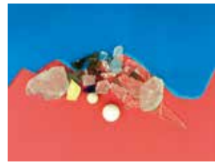
20年前の海の忘れ物