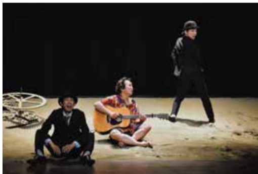
「ピロートーキングブルース」(2019)

さて、最新作『スモール アニマル キス キス』では役者たちが、小動物に扮するのでしょうか? キュートかつ妖しい題に於ける、「愛」のかたちも気になるところです。