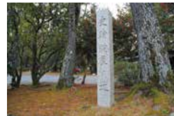
鍵屋ノ辻は県指定史跡となっており、伊賀の名所として健在