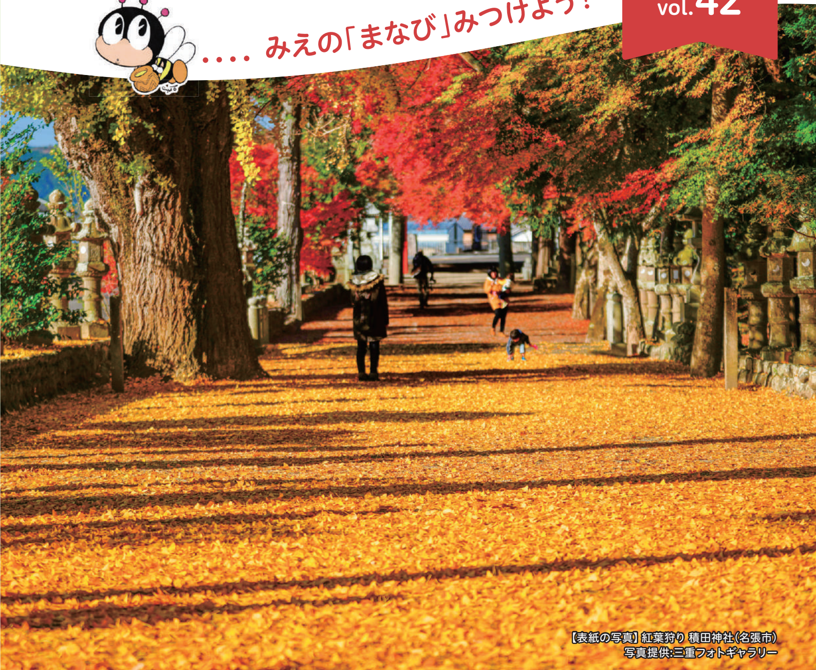
【表紙の写真】紅葉狩り 積田神社(名張市)