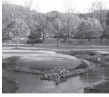
伊賀市の城之越遺跡公園

三重県内に所在する遺跡や古墳は、考古学上、あるいは日本史上のなかでどのような意義があるのでしょうか。発掘調査によって明らかとなった遺跡を中心に、それがもつ学問的な意義や面白さを分かりやすく解説します。