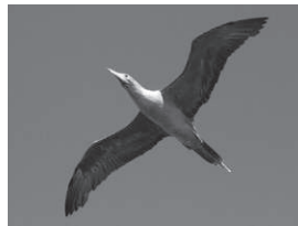
飛翔するアカアシカツオドリ