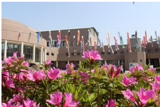
期間後半にはサツキも咲いてきます