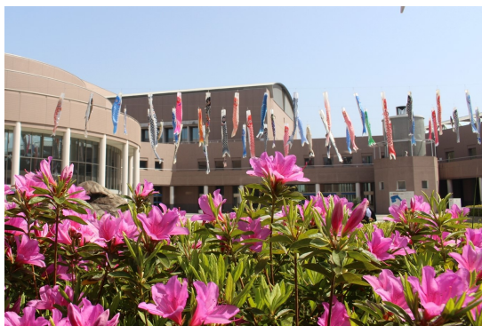
期間後半にはサツキも咲いてきます

春のそうぶんに行こうよ！ こいのぼりがいっぱい！！チラシ 思いをつなぐガーランド台紙