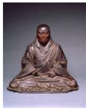
三重県指定有形文化財親鸞聖人坐像 専修寺蔵

高田本山専修寺所蔵の国宝西方指南抄、国宝三帖和讃、重要文化財の親鸞聖人消息を軸に日本の文化史・思想上重要な位置を占める親鸞を紹介し、晩年、京にいた親鸞と遠く離れた関東の門弟たちの交流を、親鸞直筆の消息や典籍からひもとくとともに、それらの宝物を伝える高田本山の歴史を、重要文化財専修寺文書を中心に展示します。