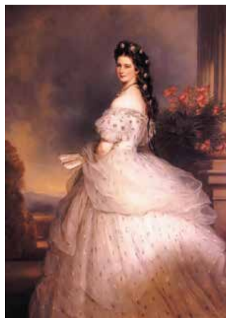
ハプスブルク帝国、最後の皇妃エリザベト

1898年、シシィ暗殺。1914年、その甥もサラエヴォで暗殺され、第一次世界大戦が勃発。1916年には皇帝が没し、2年後にハプスブルク帝国は消滅した。しかし、いまでも音楽だけは変わらずウィーンを彩り、唯一無二の陰影を与えつづけている。