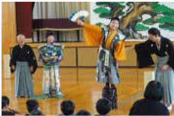
小学校での狂言授業

番組が始まったのが2003年。学生たちが子どもの頃に、流行していたのですね。だからなのか、他の古典芸能より狂言は身近に感じているようです。ちょっとしたできごとが、興味を深め本物に触れるきっかけになるものです。伝統芸能を「ややこしや」と思わずに楽しんでください。