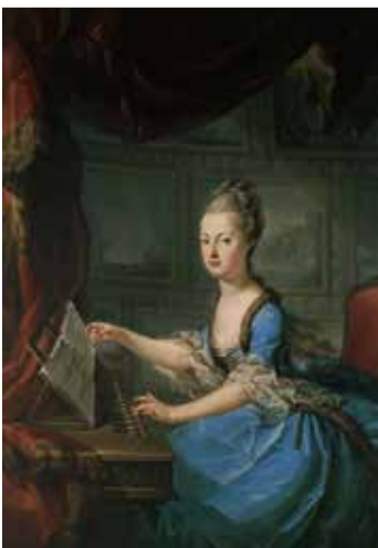
チェンバロを弾く 皇女マリー・アントワネット

しかし、楽譜は嘘をつかない。マリー・アントワネットが作曲したなかでも最も有名な歌曲「それは私の恋人」は、田園を舞台に羊飼いと村娘の恋を描いた詩人フロリアンの歌詞に曲をつけたもの。音楽を愛し、花々や自然を愛し、子どもたちと、健やかで美しいすべてのことを慈しんだマリー・アントワネット。素朴な響きは、「ほんとうのマリー・アントワネット」を私たちに教えてくれるようだ。