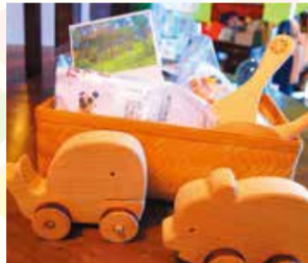
写真はイメージです。