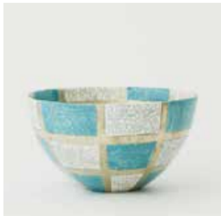
苦米地正樹 / Kachinaボール ¥21,600(税込)

萬古焼の特徴は、優れた耐熱性と、焼き方や形にとられない自由さと多彩さ。その多彩さは「萬古の印があることが一番の特徴」と言われるほど。四日市市の代表的な地場産業として伝統工芸品に指定されており、紫泥の急須や土鍋が有名です。伊勢志摩サミットでは、萬古焼の盃が首脳陣の乾杯の際に使用されました。