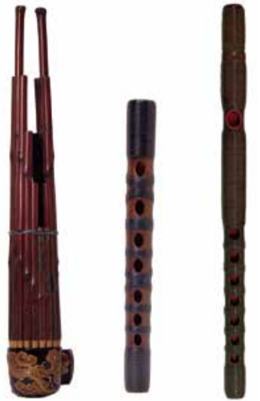
笙 しょう 箏 ひちりぎ 龍笛 りゅうてき

雅楽には笙や箏など、どんな構造になっているのか、なぜあんな音が出るのか興味津々の楽器が他にもあります。優雅な旋律を楽しんだあとに、知る楽しみ、さらに演じる楽しみにも挑戦してみたいかがでしょうか。