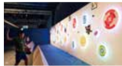
定番の手裏剣 (写真は先行開催の日本科学未来館の様子)

子どもたちに人気の忍者です。定番の手裏剣をはじめとして、体験コーナーを設置。子どもたちに人気の忍者について、三重大学などによる最先端の科学的検証も踏まえた、体感できる展示です。わかりやすく忍者の技術や身体能力、知恵に迫ります。