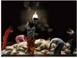
「プール」(2014年上演)

全国から公募で選ばれた劇団が小ホールに2週間滞在し、新作をつくるMゲキ→ネクスト。今年に狂言の演出経験もある京都の注目劇団が登場!