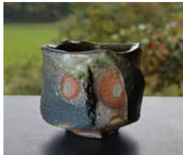
新学 / 伊賀島茶碗 ¥86,400(税込)

秋の食卓を彩る魅力的な器をMikkeで販売いたします。伊賀焼、萬古焼だけでなく、木工作家・FUTOSHIさんによる木器も取り扱います。紹介した作家のほかに、たくさんの器を取り揃えておりますので、ぜひこの機会に特別な一品をお買い求めください。