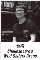
台湾 Shakespeare's Wild Sisters Group