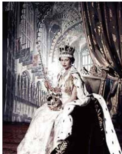
ヘンデル「ジョージ2世の戴冠式アンセム」は、エリザベス2世をはじめ歴代の英国君主の戴冠式に使用されている。

その甲斐あってか、ジョージ1世は1723年、ヘンデルを王室礼拝堂作曲家に任命。その息子ジョージ2世も、自らの戴冠式をはじめ重要な儀式でヘンデルに作曲を依頼しました。ヘンデルの音楽が、優雅なのにどこかスリリングでカッコイイのは、各国宮廷を股にかけ活躍した人生のせいなのかも、と私は密かにときめいています。