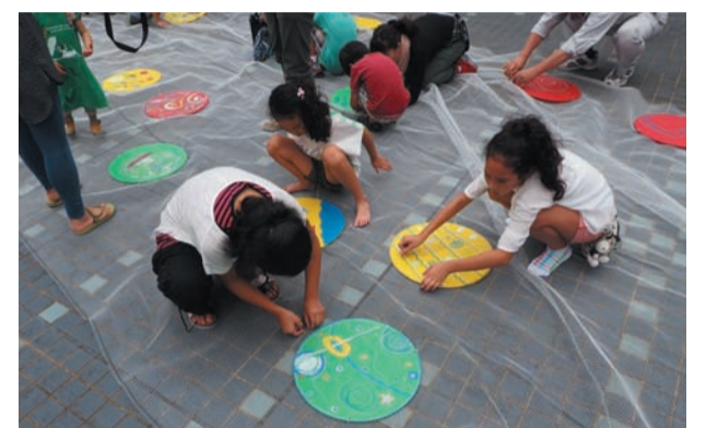
M祭! 2014 アートプログラムの様子

10:00~16:00 入場無料 一部事前申込制、整理券配布のイベント有 対象:小学生(幼児が体験できるイベントもあります。) 関三重県総合文化センター総務部 059-233-1105