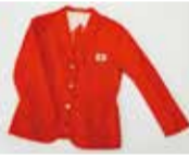
東京オリンピックデレガーションユニフォーム(秩父宮記念スポーツ博物館蔵)

三重県総合博物館 第18回企画展「オリンピック・パラリンピック 栄光の軌跡~秩父宮記念スポーツ博物館三重巡回展~」に併せて、1964年に開催された東京オリンピックの公式記録映画を上映します。