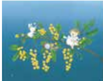
イラスト:服部美法

童謡や唱歌など、なじみ深い名曲の数々を、ピアノ伴奏にあわせてみんなで一緒に歌います。経験、年齢を問わず、歌の好きな方のご参加お待ちしております。