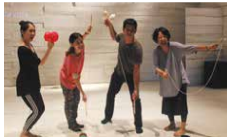
日台文化交流ワークショップ(津市美里町)