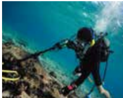
宇根村木崎海底遺跡

水中・海事考古学は、考古学の一分野で、ヒトが残した遺跡や遺物から過去を読み解く学問です。水中遺跡の発掘調査の内容や、沈没船遺跡と海城史についてご紹介します。