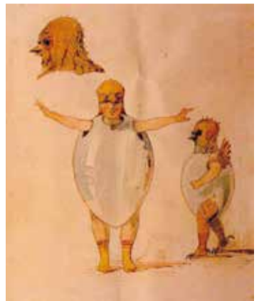
第5曲「卵の殻をつけた雛の踊り」のモチーフとなった「パレエ(トリブイ)のための衣装デザイン」

CMやBGMとしてもおなじみの名曲も、じっくりと聴き直すとさまざまな発見があります。芸術の秋、150年前の芸術家たちの友情の物語に耳を傾けてみてはいかがでしょうか。