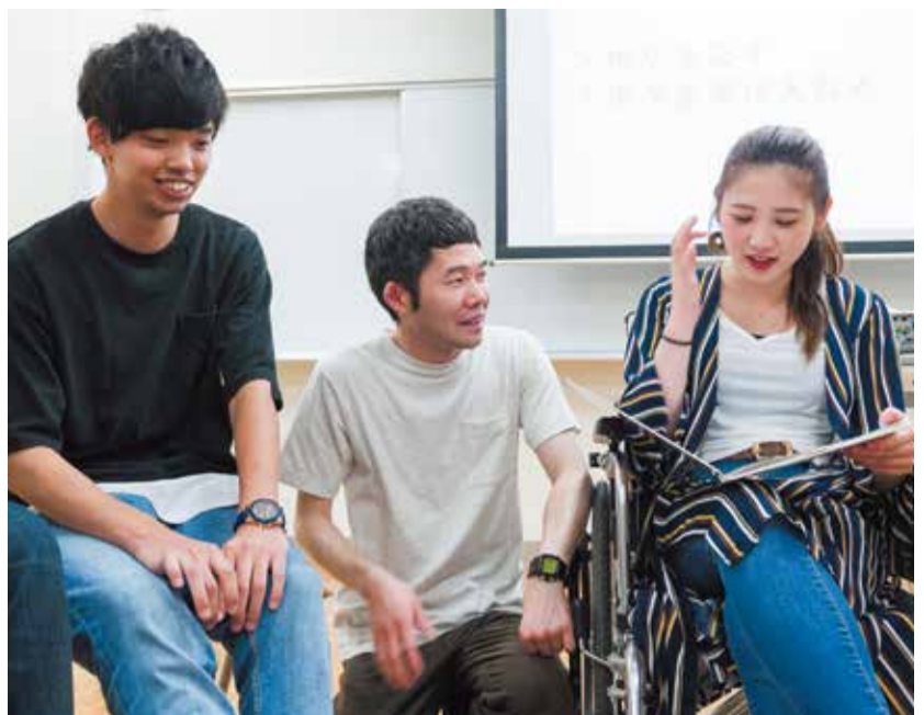
2017年6月30日 高田短期大学キャリア育成学科介護福祉コース 2年生に向けたワークショップの様子

僕はもともと東京で小劇場の俳優として活動し、20代後半にホームヘルパー2級の資格をとって老人ホームで働くようになりました。その時に、演劇のレンズで老人ホームを眺めたらとても面白かったんですね。まずお年寄りが歩いている姿に俳優として負けているな、と。背後に字幕でその人のストーリーを流せば、もう立派な演劇。お年寄りほどいい俳優はいないと思いました。あとは、介護者は俳優になった方がいいのではないかという実感。老人ホームで働いていると、認知症の方に息子や時計屋に間違われたりするんです。最初は訂正していたけど、その症状をそのまま受け入れることで、今までにない楽しいような表情で語ってくれる。そんな経験があって、認知症の人とのコミュニケーションを演技を通して考えるようになったんです。認知症の人はこちらからするとおかしな言動、小さな失敗が増えてきます。それは中核症状によるもので仕方ないのですが、感情はしっかり残っている。にもかかわらず失敗を指摘したり否定しては、ここは自分の居場所じゃないと思ったり、介護者に反抗したりしたくなっちゃう。その人が見ている世界を尊重した関わり方が必要なんです。そうして、2014年に移住先の岡山で結成されたOiBokkeShi(オイボッケシ)。そもそも名前の由来って？ ざぱり老いとボケと死です。世間ではマイナスのイメージがある言葉ですが、そこから得る大切なこともあると気づいたんです。老いの豊かな世界を演劇活動を通じて、地域に発信することができたら。そしてそれらを排除するのではなく受け入れる文化を地域に創出するお手伝いができたらと思っています。