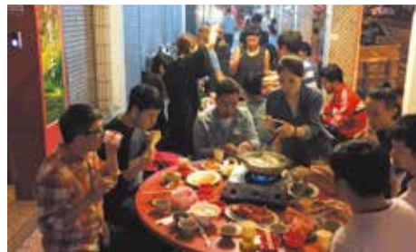
台湾公演後みんなで鍋をかきこむ(台南市)