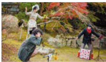
M-PAD2016 四天王寺での野外劇

[24日] そうぶんで初開催のM-PAD!!「そうぶんの竹あかり」(実施期間11月22日(水)~12月3日(日))をバックに上演します！ 会場: 三重県内飲食店など(まとめ見は四天王寺スクエア) 9月23日(土・祝) チケット発売予定 詳しくはM-PADで検索！