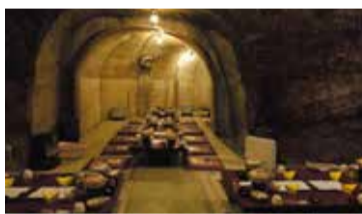
磨洞温泉涼風荘 食事処