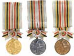
東京オリンピック 金銀銅メダル (秩父宮記念スポーツ博物館蔵)

2020年、オリンピック・パラリンピック東京大会が開催されます。4年に一度のスポーツの祭典における日本選手活躍の歴史を、日本初のメダルをはじめ、秩父宮記念スポーツ博物館所蔵資料を中心に展示します。三重会場だけの展示として、三重県出身のアスリートのほか、1964年東京大会がもたらした有形・無形のオリンピック・レガシー(遺産)についても紹介します。