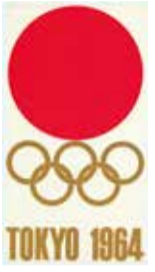
東京オリンピック公式ポスター(秩父宮記念スポーツ博物館蔵)

さて、平昌オリンピックに引き続き、2018年3月にはパラリンピック正式種目であるボッチャの国際大会が伊勢市で開催されます。さらに同年7月にはインターハイ、東京オリンピックの翌年2021年には三重とこわか国体が予定されています。これからますます熱くなる三重でのスポーツイベントもお見逃しなく!