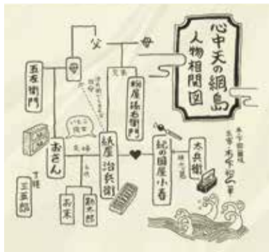
「心中天の網島」人物相関図

テレビもインターネットもなかった江戸時代、芝居小屋では実際の事件や話題の出来事をいち早く芝居に採り入れ、舞台化されていました。特に庶民の娯楽であった人形浄瑠璃や歌舞伎の作品には、古い時代の歴史上の人物や史実を題材にする「時代物」と江戸の町人社会を中心にした、当時の現代劇としての「世話物」と呼ばれるジャンルがあります。この「世話物」は、いまの言葉を使えば、いわばワイドショーのような役割で、主に巷で起こった心中事件や殺人事件を題材にして創られました。