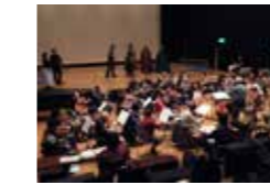
前回音楽発信オペラ「ドン・ジョヴァンニ」稽古風景