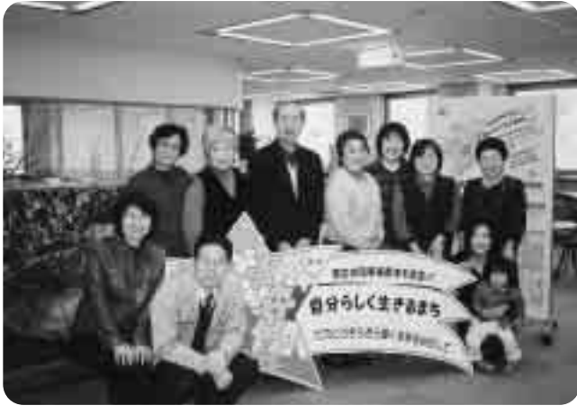
▲つどいよっかいち 女と男 (2004年3月)