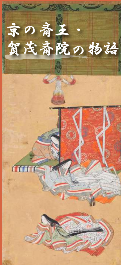
女房三十六歌仙図屏風(右隻) 斎宮歴史博物館蔵