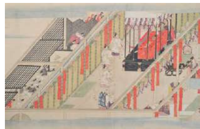
『禁中儀法講記』2巻 真阿上人筆 文政8年(1825) 西来寺蔵(津市指定有形文化財)

西来寺は室町時代の名僧・真盛上人が開いた、津を代表する名刹です。西来寺には多くの貴重な経典が所蔵されていますが、これらの多くは、江戸時代後期の学僧である真阿上人(1786～1859)が同寺に請来しました。今回のセミナーでは、真阿上人が生涯をかけてあつめた貴重な文化財を、画像を通してわかりやすくご紹介します。