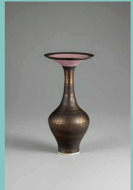
ルーシー・リー プロセス軸花器 1980年頃 井内コレクション(国立工芸館寄託)