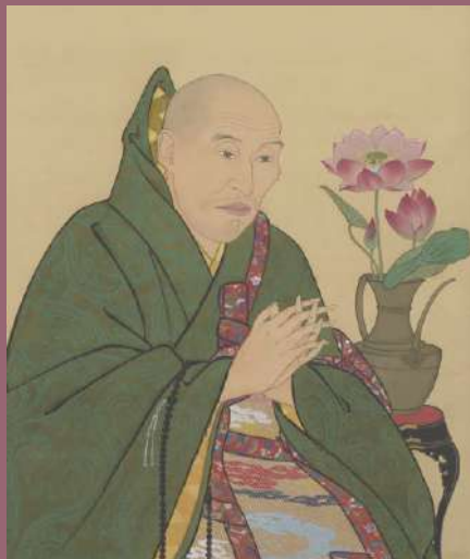
真阿上人像 1幅 原在明筆 天保7年(1836) 西来寺蔵