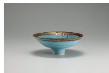
ルーシー・リー 青釉鉢 1980年頃 井内コレクション(国立工芸館寄託)

20世紀を代表するイギリスの陶芸家ルーシー・リー(1902-1995)。ウィーン工芸美術学校でろくろに出会い魅了され、陶芸家の道へと進みます。ろくろから生み出される優美な形、色彩を特徴とする独創的な作品は、多くの人々を魅了し続けています。本講演では、リーの生涯をたどりながら、展覧会の見どころをご紹介します。