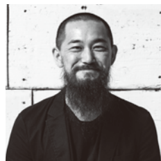
演出 鳴海康平 (第七劇場/三重)

美術:鳴海康平 舞台監督:平岡希樹(有限会社 現場サイド) 音響:山際一輝(有限会社 現場サイド) 照明:島田雄峰(LST) フライヤービジュアル:前原本光 フライヤーレイアウト:橋本純司 制作:林田古都里、高橋知美(キューズリンク)