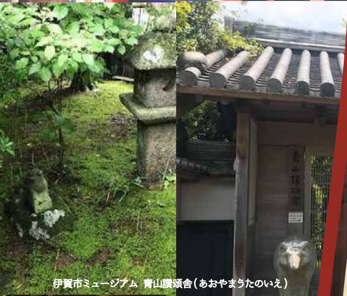
伊賀市ミュージアム 青山讃頌舎(あおやまうたのいえ)