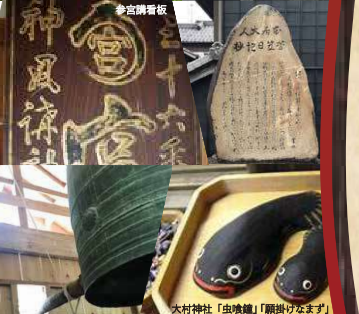
大村神社「虫喰鐘」「願掛けなます」