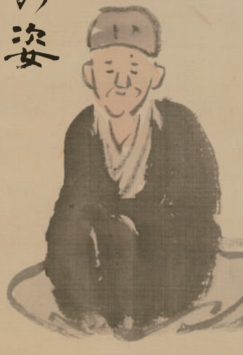
露城筆芭蕉像(伊賀市蔵)