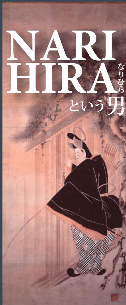
重要文化財 梓弓図 岩佐勝以筆 江戸時代 文化庁蔵