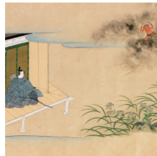
伊勢物語絵巻 上巻 第6段 芥川場面 江戸時代 斎宮歴史博物館蔵

『伊勢物語』の主人公である「昔男」のモデルとされるのは、平城天皇を父方の祖父、桓武天皇を母方の祖父に持つ高貴な血筋の貴族、在原業平という実在した人物です。史実とフィクションの間にたゆたう業平像について、ご紹介いたします。