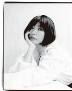
YUTO KUDO: Madame Figaro Japon

大阪府生まれ。2007年、デビュー小説『わたくし率イン 齒一、または世界』が第137回芥川賞候補に。同年、第1回早稲田大学坪内逍遙大賞奨励賞受賞。2008年、『乳と卵』で第138回芥川賞を受賞。2009年、詩集『先端で、さすわ さされるわ そらええわ』で第14回中原中也賞受賞。2010年、『ヘヴン』で平成21年度芸術選奨文部科学大臣新人賞、第20回紫式部文学賞受賞。2013年、詩集『水瓶』で第43回高見順賞受賞。短編集『愛の夢とか』で第49回谷崎潤一郎賞受賞。2016年、『あこがれ』で渡辺淳一文学賞受賞。「マリーの愛の証明」にてGranta Best of Young Japanese Novelists 2016に選出。他に『すべて真夜中の恋人たち』や村上春樹との共著『みみずくは黄昏に飛びたつ』、短編集『ウィステリアと三人の女たち』など著書多数。『早稲田文学増刊 女性号』では責任編集を務めた。最新刊の長編『夏物語』は、2020年4月に『Breasts and Eggs』(Europa Editions)として英訳が刊行され、25カ国以上で翻訳が進む。