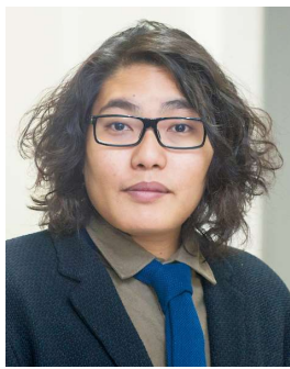
木ノ下裕一 木ノ下歌舞伎主宰 きのしたゆういち