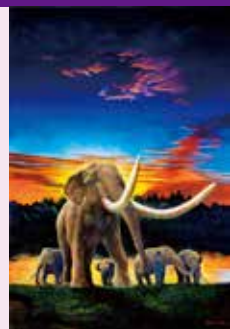
ミエゾウ復元画 画：小田隆

2011年春、三重県総合博物館の建設工事中、巨大な足跡化石が数十個発見されました。これは、三重県ではじめて化石が見つかったことからミエゾウと名付けられた国内最大の陸生哺乳類がこの場所を歩いていた証拠です。今回は、このミエゾウ、そして350万年前のミエゾウが生息していた当時はどのような環境が広がっていたか、についてお話しします。