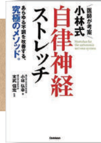
医師（医師）が考案 小林式 自律神経ストレッチ 学研プラス (2019/9/26)