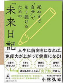
死ぬまで「自分」で あり続けるための 「未来日記」 幻冬舎・(2019/12/19)