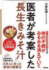
医者（医師）が考案した 「長生きみそ汁」 アスコム (2018/6/30)