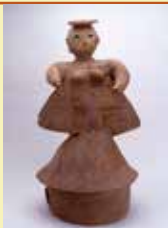
寺谷古墳群出土巫女形埴輪