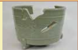
青磁香炉(安養寺跡出土) 明和町蔵