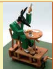
「モンマルトルのアムビス」 ポール・スプーナー&マット・スミス 1989年 ©Paul Spooner and Matt Smith