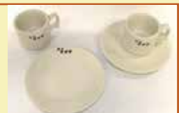
亀山市で一番最初の喫茶店 「喫茶オオタ」のカップ