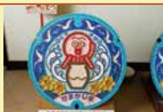
日間賀島(愛知県)のマンホール