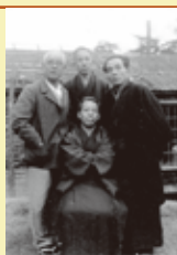
乾比根会メンバー