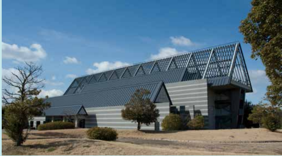
鈴鹿市考古博物館

鈴鹿市は、畿内から東国への交通の要衝の地として古代から栄え、奈良時代には、「国府」と「国分寺」が置かれるなど、歴史と文化に富んだところです。伊勢国分寺跡の隣接地に、平成10年に開館した鈴鹿市考古博物館を学芸員さんの案内で見学し、その後、弥生時代後期と古墳時代後期の集落、磐城山(ばんじょうざん)遺跡発掘現場を巡ります。