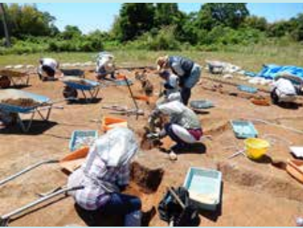
磐城山遺跡発掘現場

2017年 10月5日【木】 13:30 ▶ 16:00 (受付 13:00～) ※荒天中止