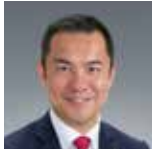
【鈴木英敬知事プロフィール】

1963年生まれ。2歳までシアトルで過ごし、東京都三鷹市で育つ。1984年新日本プロレス入門。同年10月5日、武藤敬司戦でデビュー。1991年第1回G1クライマックスで優勝し、その後V5達成。1992年第75代NWAヘビー級王座を奪取。1996年にはnWo ジャパンを設立し一大ムーブメントを起こす。1998年IWGPヘビー級王座獲得。2010年2月に新日本プロレスを離れ、それ以降フリーランスとして活動。1999年12月にはオリジナルブランド「ARISTRIST(アリストトリスト)」を設立。2014年7月には救命救急の啓発活動を主とした一般社団法人ニューワールドアワーズスポーツ救命協会を設立。今年4月に発足した「みえのイクボス同盟」スペシャルサポーターにも就任した。