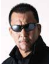
【蝶野正洋さんプロフィール】

プロレス界のレジェンド、「黒のカリスマ」の異名をとる蝶野正洋さんがフレンテみえに登場!!! 海外での武者修行をきっかけに国際結婚、2人のお子さんがいらっしゃる蝶野さん。 強面でヒール(悪役)の印象が強く、家庭の中でも「亭主閑白で、子どもには背中語る親父」像を思い浮かべて しまいますが、実際はどのようなのでしょうか? 子育てへの関わり方、妻とのパートナーシップ、そして社会貢献活動。 鈴木英敬三重県知事とのトークで、リングの外でも最強の蝶野さんの生き様に迫ります。 第3回「ファザー・オブ・ザ・イヤー in みえ」表彰式を同時開催!