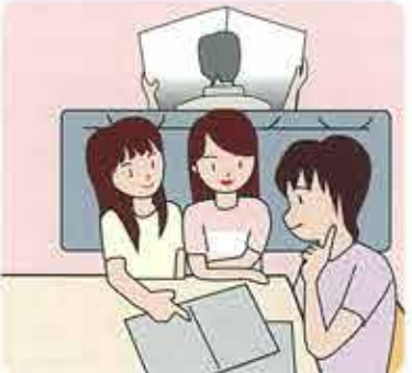
総務省「社会生活基本調査 (H13)」より

結婚してもう30年が過ぎました。夫は仕事一筋、私は子育てにがんばってきました。つらいこともいろいろあったけど、幸せでした。だんだん子供に手がからなくなると、家族の会話も少なくなりました。最近ふと思えます。「これからどうなるのだろう……」