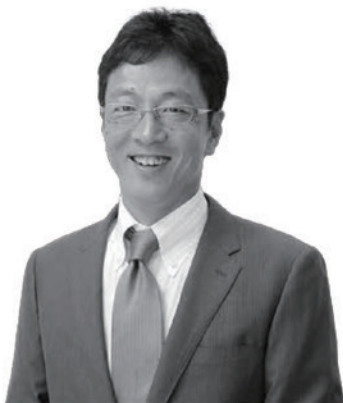
三井物産ロジスティクス・パートナーズ株式会社 代表取締役社長