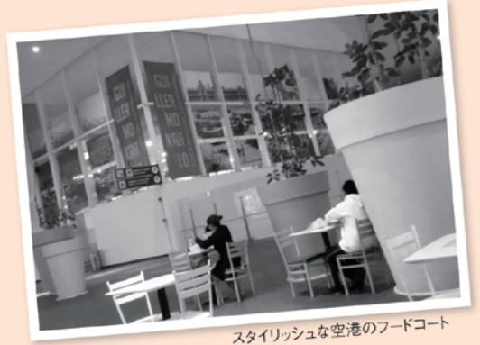
スタイリッシュな空港のフードコート