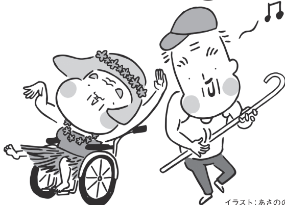
イラスト:あさのい