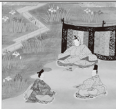
「伊勢物語図色紙」より「八橋」 齋宮歴史博物館