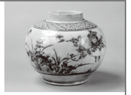
《色絵牡丹文壺》桑名市博物館蔵