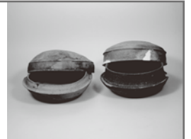
鈴鹿市考古博物館蔵

企画展① 鈴鹿の古墳Ⅰ —ちいさなちいさな古墳たち— 7月16日(土)▶9月19日(月・祝)