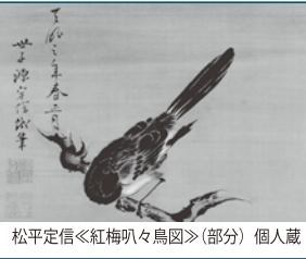
松平定信<<紅梅叭々鳥図>>(部分) 個人蔵