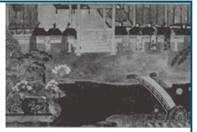
駒競行幸絵巻(重要文化財) 和泉市久保惣記念美術館蔵